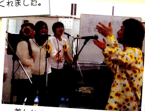
美しいハーモニーを豊かせてもらいました。