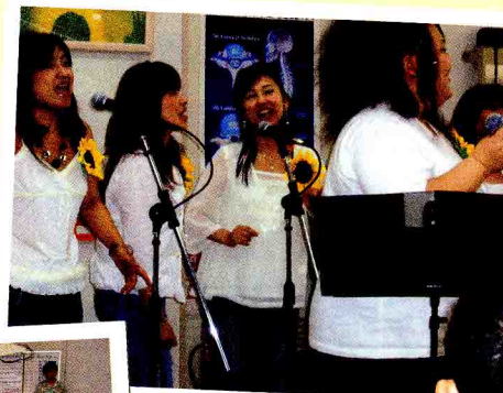
みなさん楽しそうに歌ってます。