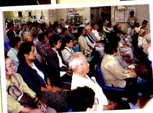
たくさんの方が参加してくれました。