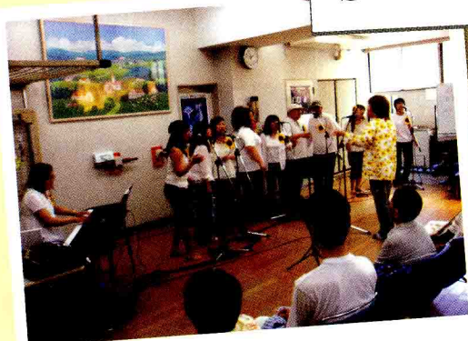
懐かしい曲をたくさん歌ってもらいました。